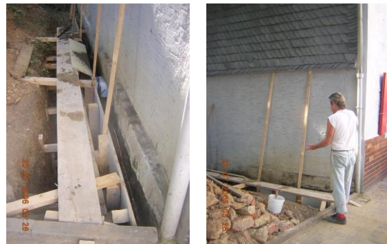
Instandsetzungsarbeiten im Stadtteil Bornheim an den Fundamenten eines Gebäudes, das von der Wohnsitzloseninitiative LAZARUS genutzt wird.

Die Bauarbeiten wurden von einem erfahrenen Maurermeister, der viele Jahre in einer überbetrieblichen Ausbildungsstätte tätig gewesen war, geleitet. Er verfügte neben den entsprechenden fachlichen Kenntnissen im Maurerhandwerk über weitreichende Kenntnisse im Zimmermannshandwerk, im Trockenbau und im Fliesenlegerhandwerk. Neben den grundlegenden Arbeitstechniken vermittelte er auch Kenntnisse in der Arbeitsorganisation. Unterstützt wurde er auf der Baustelle von einem Gesellen, der vorher viele Jahre als Maurer gearbeitet hatte.