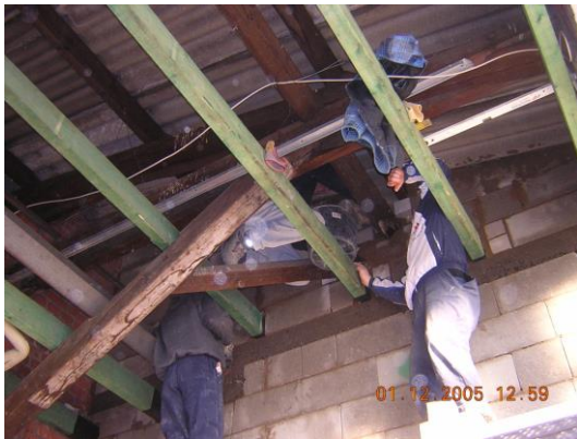
Arbeiten an einer Zwischendecke aus Holz in einer Werkhalle auf dem ehemaligen Teves-Gelände im Stadtteil Gallus im Rahmen des Projektes „Soziale Stadt Gallus“

Der gemeinnützige Baubetrieb mit dem Namen „Bauhof Alt und Jung gGmbH“ war im Oktober 2005 gegründet worden. In Kooperation mit Fachfirmen und Fachplanern bot er bis Ende 2016 arbeitslosen Jugendlichen, die keinen oder einen sehr schlechten Hauptschulabschluss hatten, eine Chance zur Berufsorientierung.