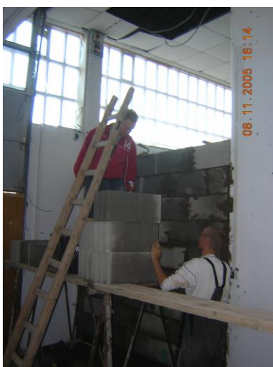
Maurerarbeiten zur Errichtung einer Brandwand ebenfalls auf dem ehemaligen Teves-Gelände

Der Bauhof vermittelte den Jugendlichen Kenntnisse der Arbeitsorganisation und grundlegende Arbeitstechniken. In Abhängigkeit von der Baustelle wurden Fertigkeiten im Maurer- und Betonbauerhandwerk, im Zimmererhandwerk, im Fliesenlegerhandwerk und im Trockenbau vermittelt.