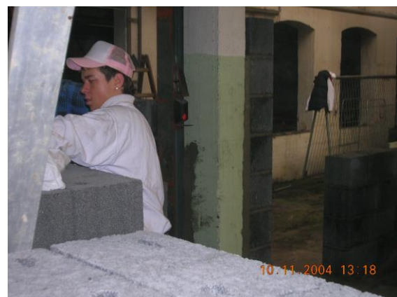
Maurerarbeiten in einer ehemaligen Schlosserei im Stadtteil Höchst, die für eine kulturelle Nutzung durch eine Schule umgebaut worden ist

Die konkreten Lernschritte, die die Arbeitsorganisation betreffen, wiederholen sich auf jeder Baustelle, auch wenn sie im Einzelnen immer an die jeweiligen Örtlichkeiten angepasst werden müssen. Diese grundlegenden Kenntnisse wurden also am intensivsten eingeübt. In welchem Umfang die einzelnen Gewerke ausgeführt wurden, hing von der Auftragslage ab. Das Ziel war, möglichst viel Abwechslung zu gewährleisten, um eine bereite Orientierung zu geben und Interesse zu wecken bzw. wach zu halten.