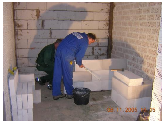
Errichten einer Trennwand aus Glasbetonbausteinen in einem zukünftigen Künstleratelier.